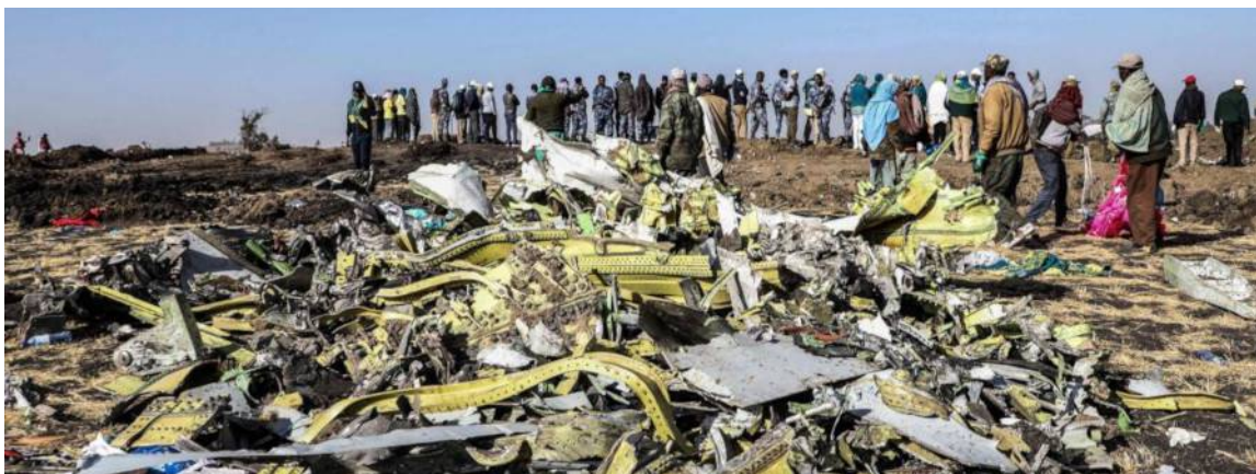
Ethiopie, 10 mars 2019 : 157 morts, dont 9 Français, dans le crash du Boeing 737 MAX