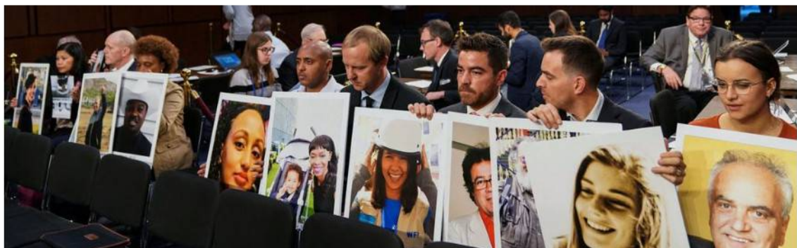
The Wall Street Journal, 31 mai 2023

Article WSJ (abonnés) : https://www.wsj.com/articles/boeing-737-max-victims-families-can-seek-compensation-for-pain-and-suffering-judge-rules-6dd8aef5