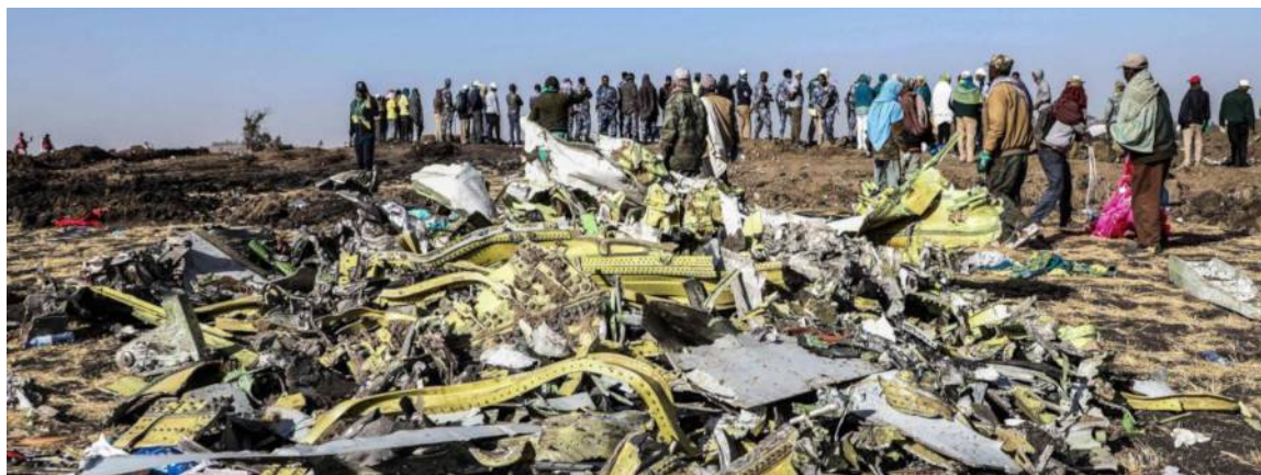
Ethiopie, 10 mars 2019 : 157 morts, dont 9 Français, dans le crash du Boeing 737 MAX