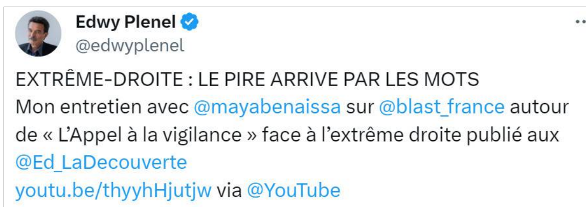
Tweet d'Edwy Plenel, 11 juin 2023

Lien vers le tweet : https://twitter.com/edwyplenel/status/1667805735369965568