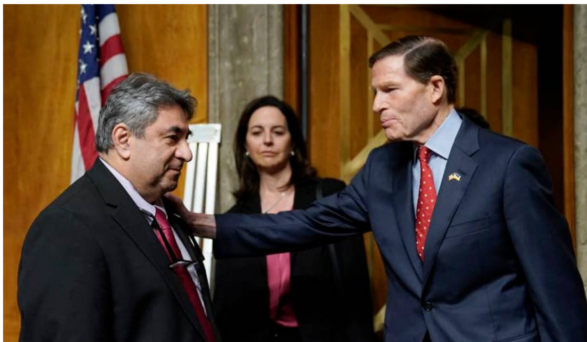
17 avril 2024 : le sénateur Richard Blumenthal (à droite) félicite le lanceur d'alerte Sam Salehpour

Sécurité aérienne : aux Etats-Unis une spectaculaire opération Mains propres est en cours depuis les deux crashes de Boeing 737 MAX en 2018 et 2019.